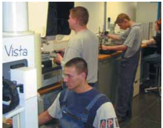
Auszubildende beim betrieblichen Unterricht